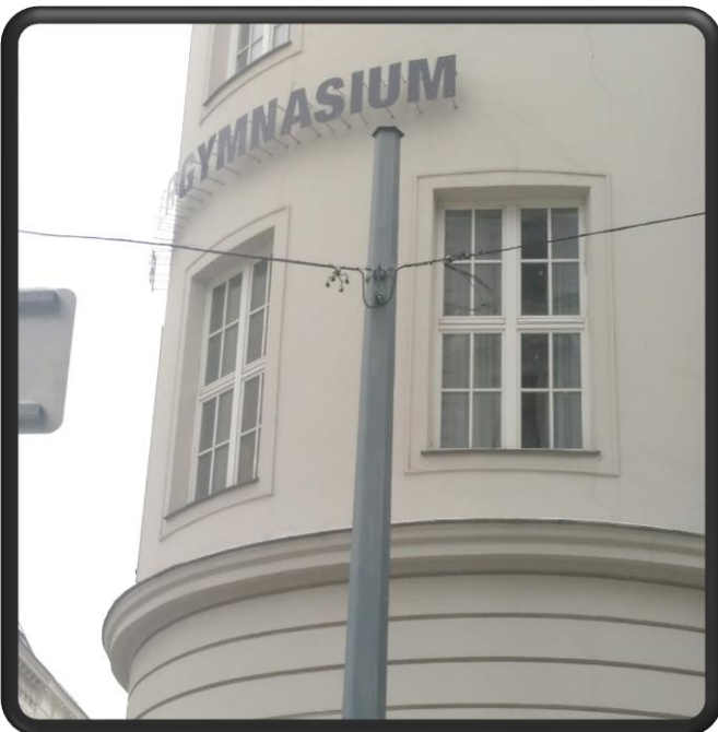
Bild 3: Du stehst jetzt vor einer großen Schule. Vor dem Schultor ist ein großer Metallsteher. Darauf befindet sich ein Verkehrsschild. Es zeigt, dass die Durchfahrt zu einer bestimmten Straße für LKW und Busse nicht möglich ist. Zu welcher Straße?

Bild 2: Den zweiten Ort den wir suchen, kennst du vermutlich sehr gut. Einmal im Jahr, nämlich Ende November am Christkönigssonntag, feiert die Jungschar hier ein großes Fest. Welches?