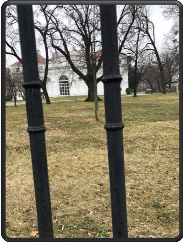
Bild 7: Zur Abwechslung gibt es diesmal kein Foto vom Ort den du suchst sondern ein Bilderrätsel. Welche Gasse könnte hier gemeint sein?

Bild 6: Was steht auf der rechten Tafel mit dem roten Kreis drumherum, wenn man auf die Ausfahrt schaut?