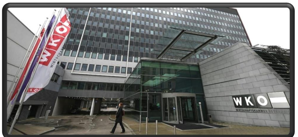
Bild 4: Vor diesem großen Gebäude führt eine Straße vorbei, die dann auf die Wiedner Hauptstraße trifft. Wie heißt diese Straße? (ß=ss)

Bild 3: Du stehst jetzt vor einer großen Schule. Vor dem Schultor ist ein großer Metallsteher. Darauf befindet sich ein Verkehrsschild. Es zeigt, dass die Durchfahrt zu einer bestimmten Straße für LKW und Busse nicht möglich ist. Zu welcher Straße?