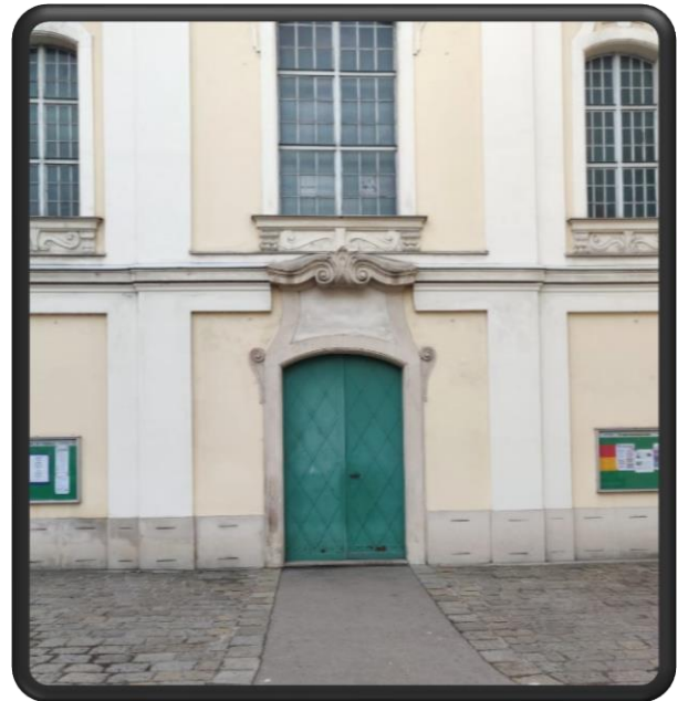
Bild 2: Den zweiten Ort den wir suchen, kennst du vermutlich sehr gut. Einmal im Jahr, nämlich Ende November am Christkönigssonntag, feiert die Jungschar hier ein großes Fest. Welches?

Bild 1: Du bist jetzt bei einem Park. In welchem Ding in diesem Park kann Fußball gespielt und im Winter auch eisgelaufen werden? Wie heißt dieses Ding?